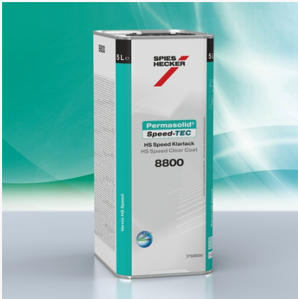
Permasolid® HS Speed Klarlack 8800