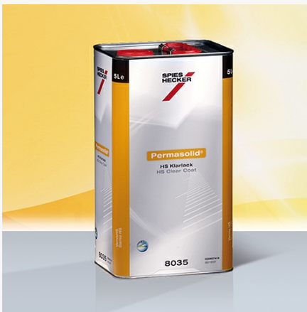
Permasolid® HS Klarlack 8035