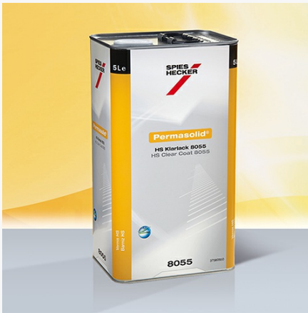
Permasolid® HS Klarlack 8055