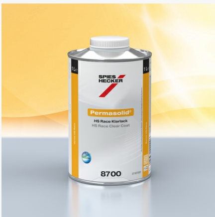
Permasolid® HS Race Klarlack 8700