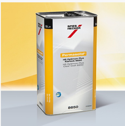
Permasolid® HS Optimum Plus Klarlack 8650